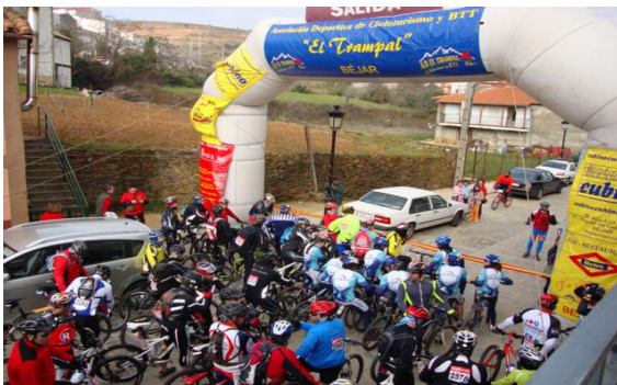
Salida de Ciclistas en Sotoserrano 2010

Es una ocasión única de pedalear por zonas de un valor natural extraordinario en compañía de cientos de aficionados de muchas procedencias, disfrutando de un paisaje único y de una climatología generalmente benigna dada la ubicación, altitud y orientación de los Valles del Alagón y Las Hurdes.