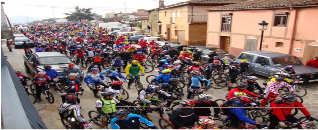
Salida de ciclistas en Sotoserrano 2010

Todos los años en Marzo se celebra una marcha MTB en Sotoserrano organizada por la Asociación Deportiva El Trampal en colaboración con los Ayuntamientos de Sotoserrano y Caminomorisco . Es una de las marchas de referencia en el panorama de la bicicleta de montaña que en 2010 cumplió su 18 aniversario y reunió a más de 700 ciclistas. En esta marcha donde se reúnen cientos de ciclistas es ya una cita tradicional del comienzo de la temporada para muchos bikers.