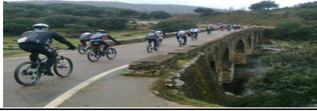
Plano del Recorrido de la Ruta Ciclista