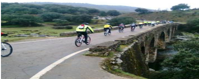
Ciclistas cruzando el Puente Romano sobre el Alagón

Continuaremos por este camino hasta que veamos que a nuestra izquierda surge otro con fuerte pendiente (punto 8). Este ramal nos conducirá a otra pista que desciende por la ladera (punto 9). Nos incorporaremos a ella en dirección descendente. Empezaremos a circular paralelos al Arroyo Servón ; si es primavera u otoño traerá agua y si es verano es probable que esté seco. Cruzaremos el cauce por un puente (punto 10). Poco antes de llegar al puente y muy próxima al arroyo existe una fuente que nos permitirá aprovisionarnos de agua en caso de que fuera necesario. Una vez cruzado el puente hay tres caminos uno a la derecha, otro a la izquierda y el tercero de frente. Tomaremos este último.